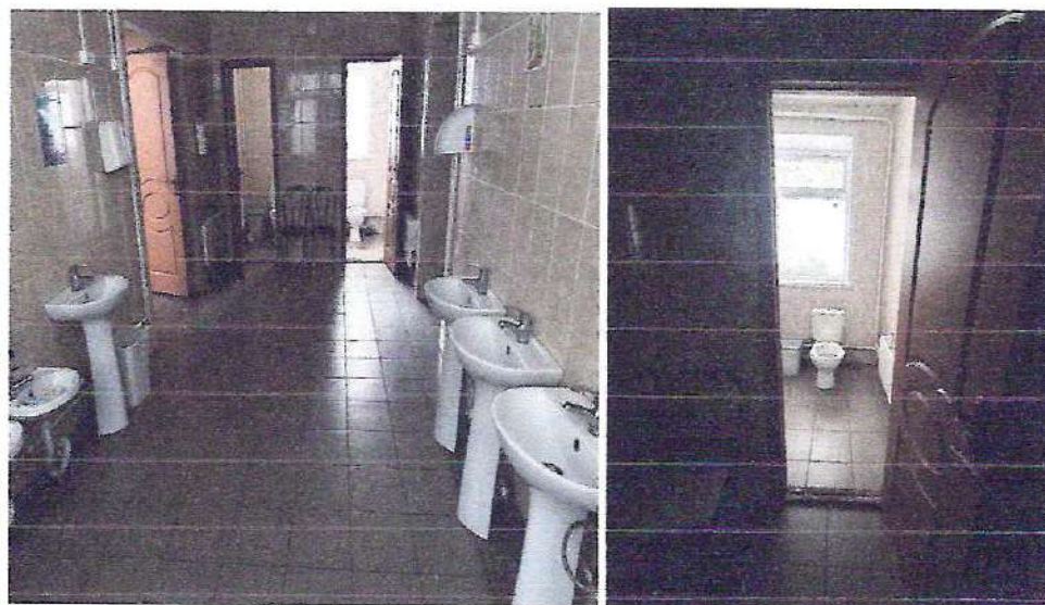
фото № 5 «Туалетная и душевая комната»

— предоставление услуги с сопровождением инвалида по территории объекта работником организации.