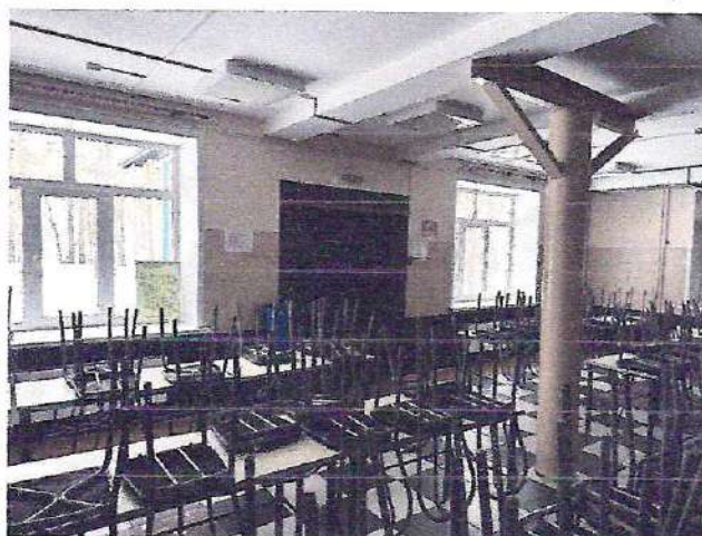
фото № 4 «Столовая»