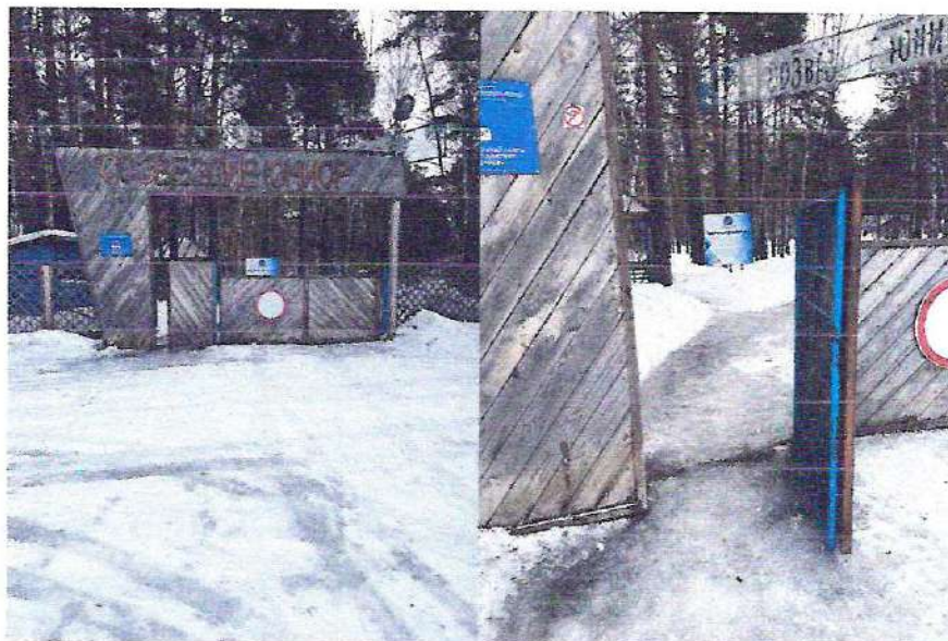
фото № 1 «Вход (выходы) на территорию»