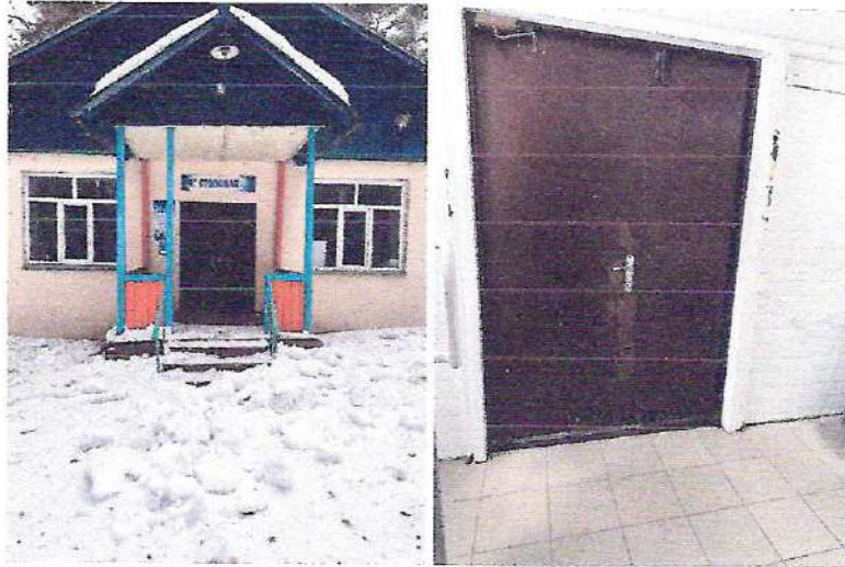
фото №3 «Центральный вход, с площадкой»