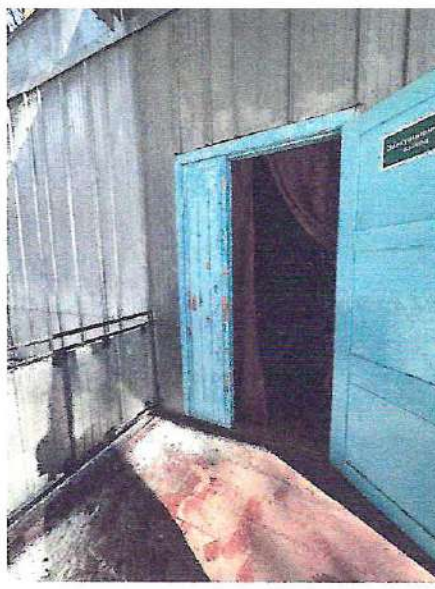
фото №2 «Двери, эвакуационный выход»