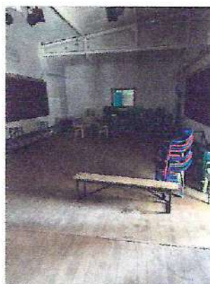
фото № 3 «Зальная зона обслуживания»