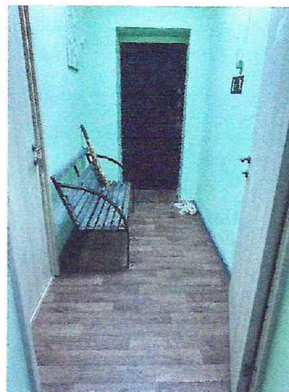
фото №4 «Тамбур»