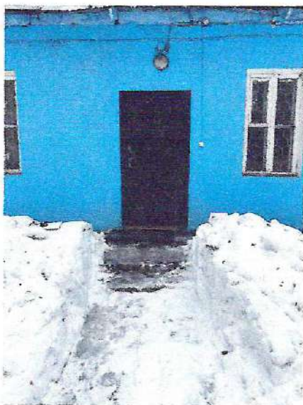
фото №3 «Центральный вход, с площадкой»