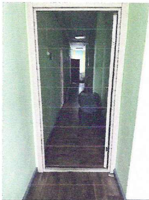
фото № 3 «Коридор»

— предоставление услуги с сопровождением инвалида по территории объекта работником организации