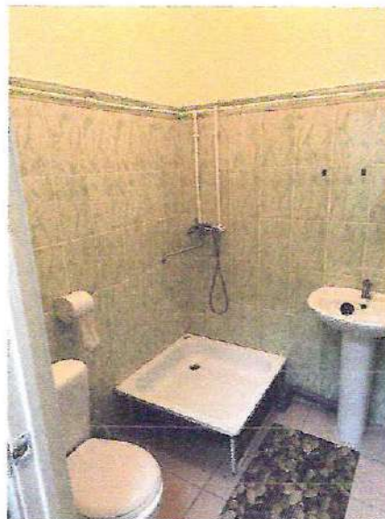
фото № 6 «Туалетная и душевая комната»

— предоставление услуги с сопровождением инвалида по территории объекта работником организации.