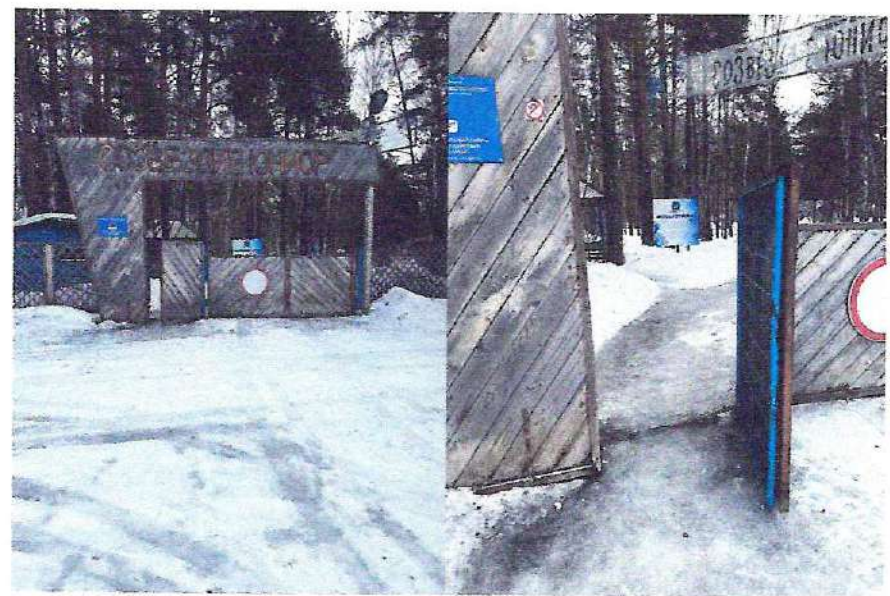
фото № 1 «Вход (выходы) на территорию»