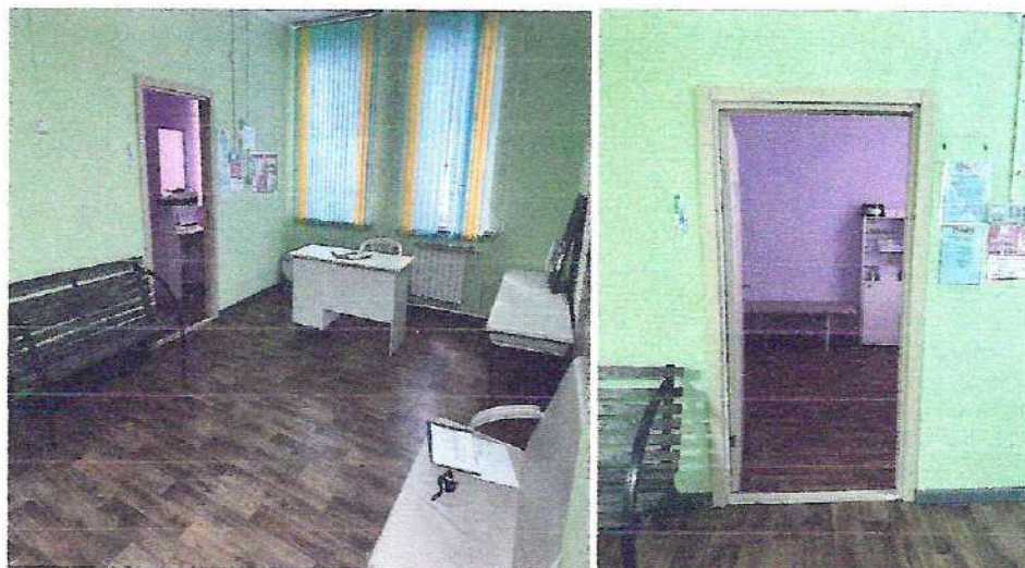
фото № 5 «Кабинетная форма обслуживания»

— предоставление услуги с сопровождением инвалида по территории объекта работником организации.