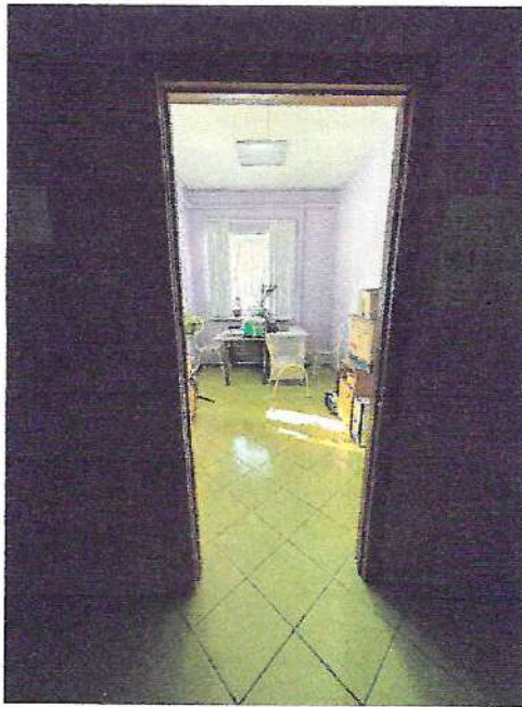
фото №5 «Кабинетная форма обслуживания»