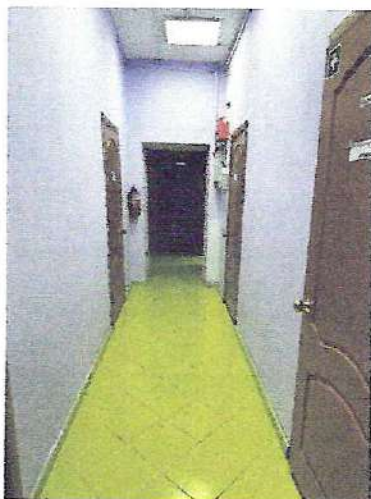
фото № 3 «Коридор»

— предоставление услуги с сопровождением инвалида по территории объекта работником организации.