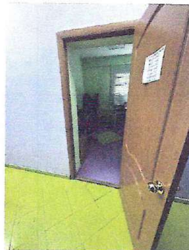
фото № 4 «Двери»