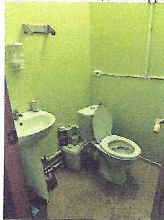
фото №6 «Санитарно-гигиенических помещений»

— предоставление услуги с сопровождением инвалида по территории объекта работником организации.