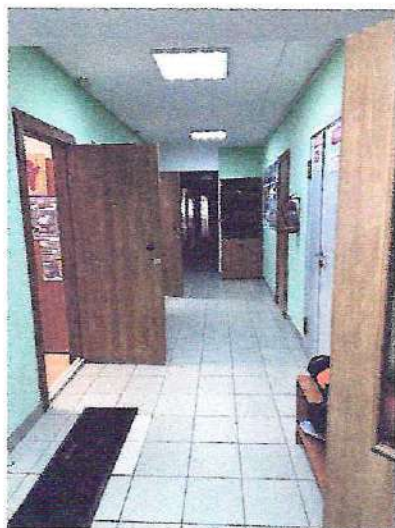
фото № 3 «Коридор»

— предоставление услуги с сопровождением инвалида по территории объекта работником организации