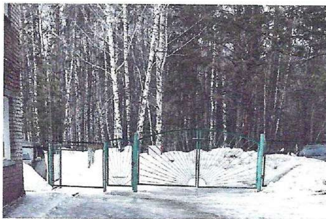
фото № 1 «Центральный вход»