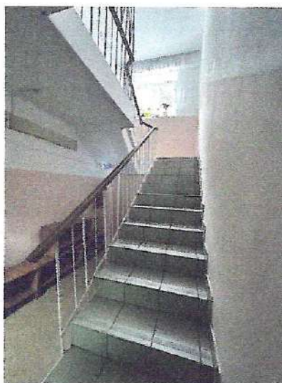
фото № 5 «Лестница внутри здания»