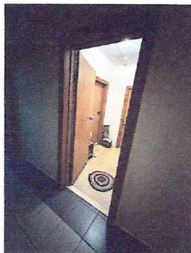
фото № 4 «Двери»