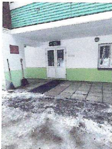
фото №1 «Центральный вход, с площадкой»